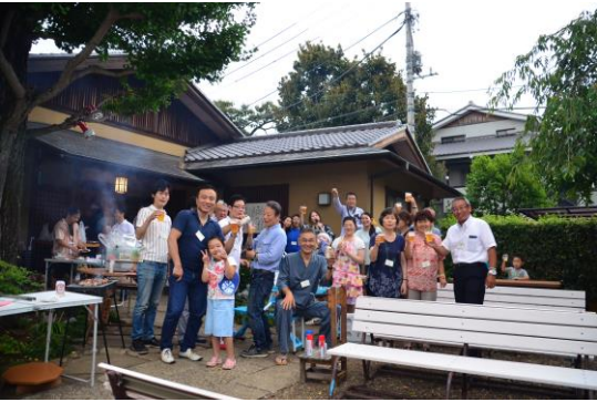
→境内バーベキュー乾杯の図