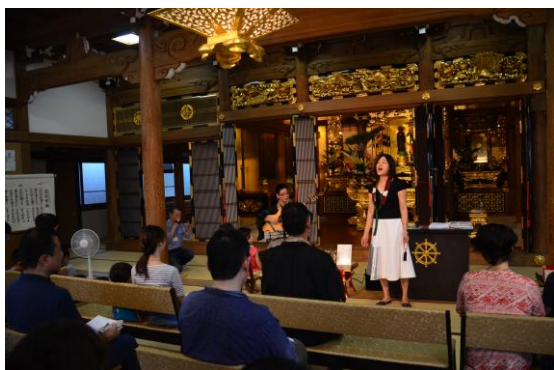
→ 仏教讃歌を歌おう