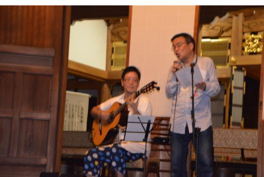
→ファイナーレ・歌とスピーチ