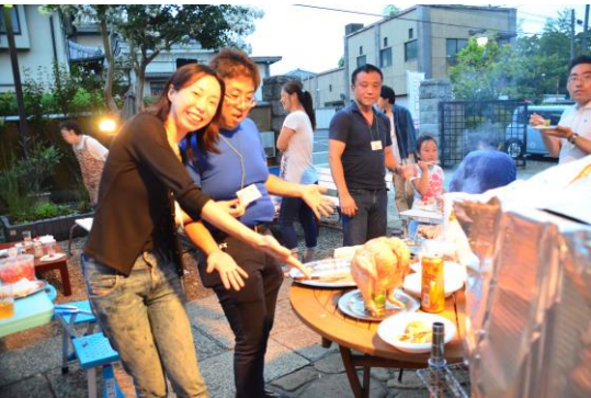
→丸鶏『ピア缶チキン』