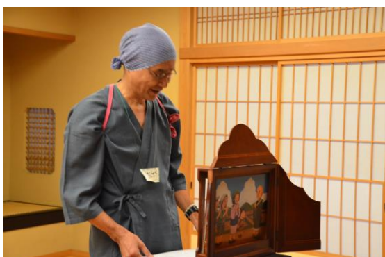
→ じゅしよくの紙芝居