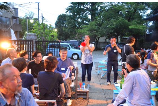
→ひとことコメントコーナー